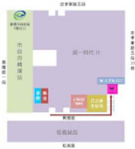
台北W飯店 人才出入口地圖.JPG 45K