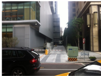
惠中路-員工出入口