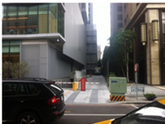
惠中路-人資辦公室入口